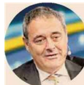
STEFANO BESSEGHINI Presidente dell'Autorità per l'energia, le reti e l'ambiente