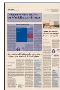
Peso: 1-5%, 5-29%