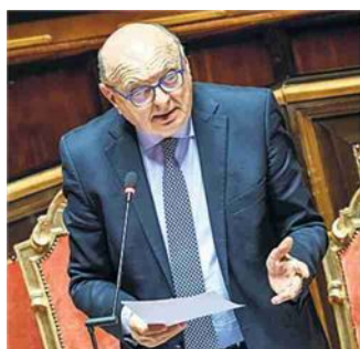
GILBERTO PICHETTO MINISTRO DELL'AMBIENTE E DELLA SICUREZZA ENERGETICA

Stiamo valutando in raccordo con il Mef che tiene i cordoni della borsa