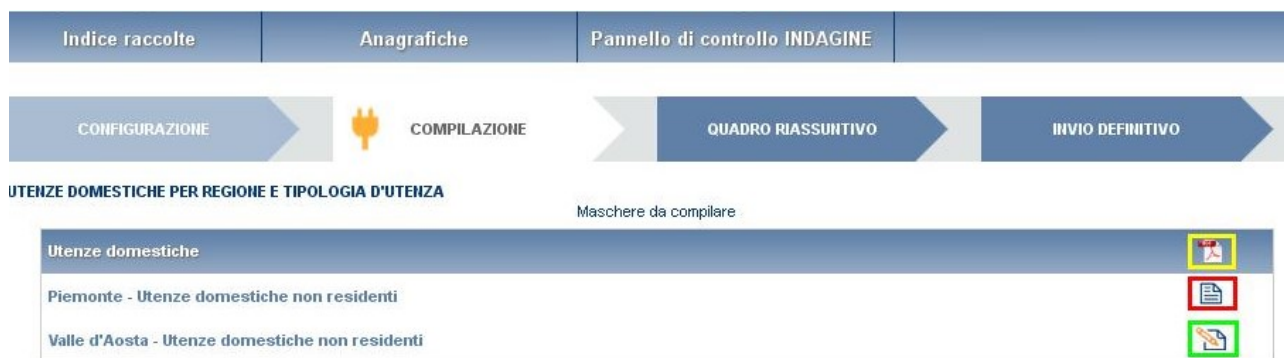
Figura 3.3: Stato compilazione delle maschere

ATTENZIONE: il pdf è scaricabile anche prima che sia effettuato l'invio definitivo dei dati.