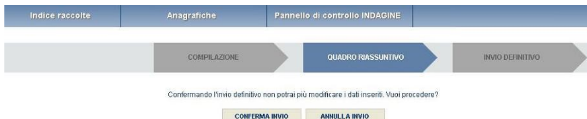
Figura 3.6: Invio definitivo

In tutti i casi se la compilazione della raccolta non è stata completata il sistema non permette l'invio definitivo dei dati e mostra un messaggio che avvisa l'utente dell'impossibilità di effettuare tale operazione. Se invece la compilazione della raccolta è completa, il sistema chiede conferma sulla volontà di effettuare l'invio o se si desidera annullare e tornare alla compilazione.