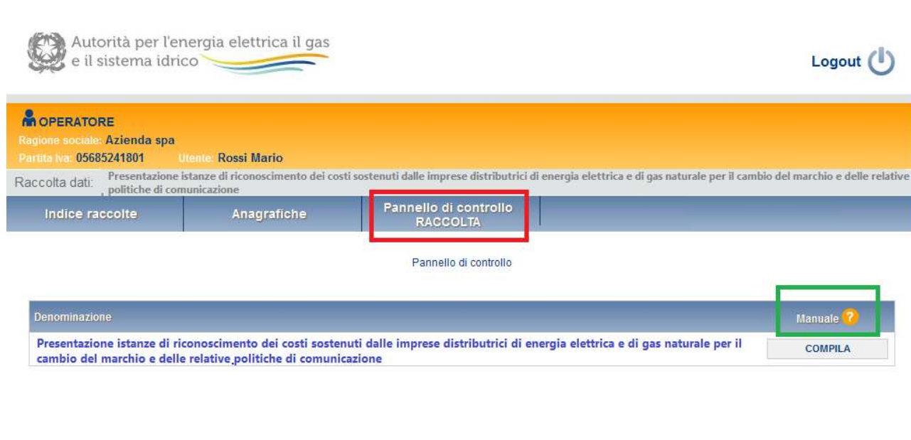
Figura 2.1: pannello di controllo

Accedendo alla raccolta viene visualizzata la pagina “ Pannello di controllo ” dove sono presenti le maschere da compilare per la raccolta (riquadro rosso in figura 2.1). Nel caso in questione è presente una sola maschera, il cui nome coincide con quello della raccolta.