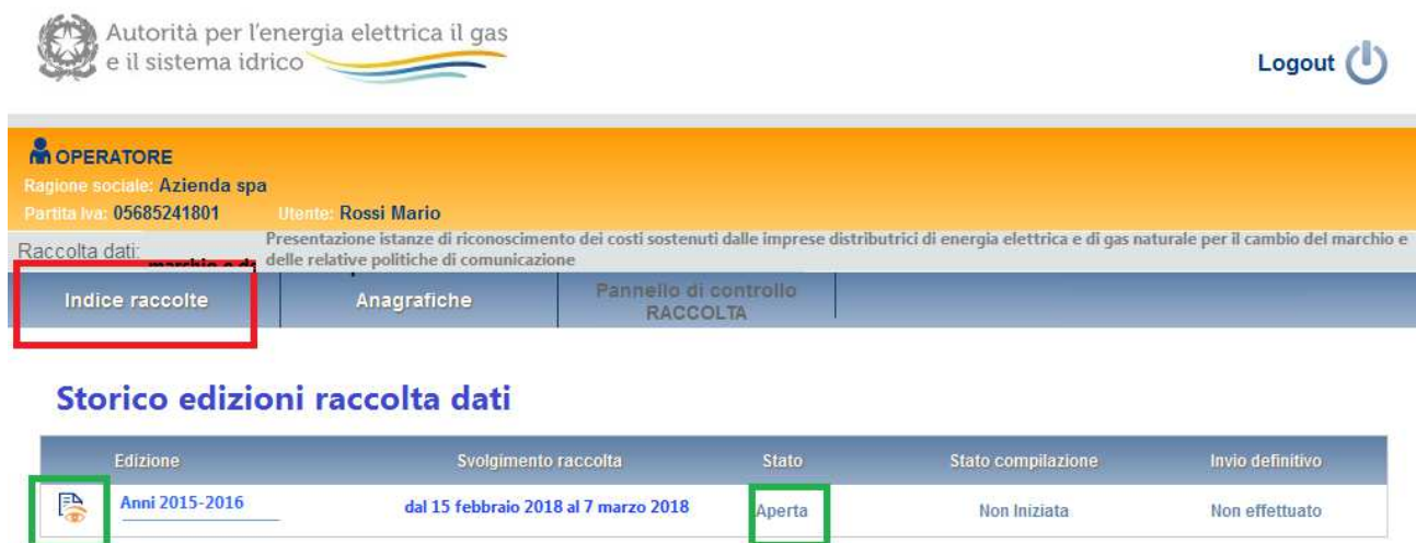
Figura 1.2: storico della raccolta

Presentazione istanze di riconoscimento dei costi sostenuti dalle imprese distributrici di energia elettrica e di gas naturale per il cambio del marchio e delle relative politiche di comunicazione ( debranding ), 15 febbraio 2018