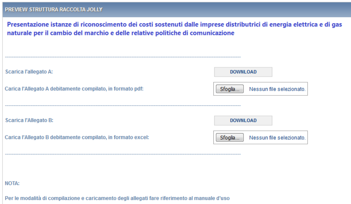
Figura 3.3: Maschera di compilazione delle informazioni