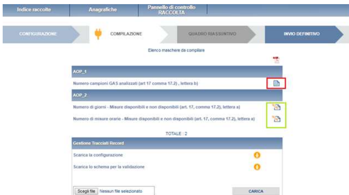
Figura 4.5: Elenco maschere dopo la compilazione