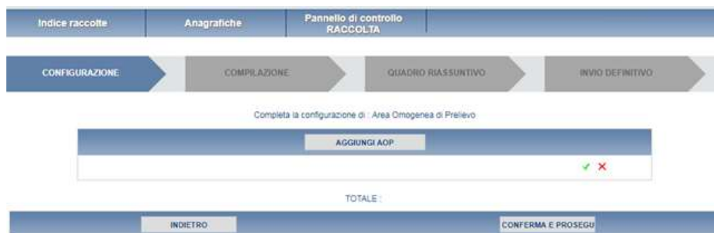
Fig 2.1 A: configurazione Area Omogenea di Prelievo