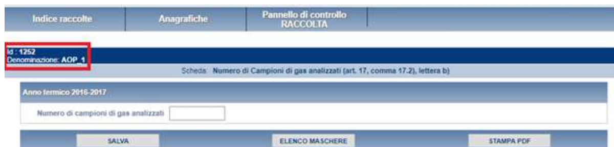
Figura 4.4: Maschera “Numero campioni gas analizzati”

Con il tasto “STAMPA PDF” sarà possibile visualizzare ed eventualmente salvare il pdf della maschera che si sta compilando, aggiornato all’ultimo salvataggio.