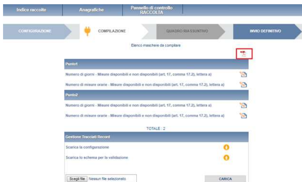
Figura 4.1: Elenco delle maschere da compilare

Al fianco del nome di ogni maschera è presente una icona che selezionata permette l’accesso alla compilazione della maschera.