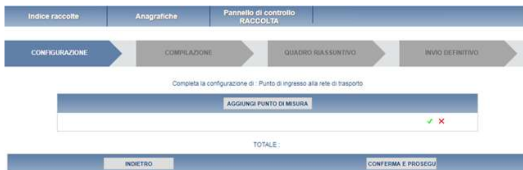
Fig 2.1 B: configurazione Punti di Misura

Nelle figure 2.2 e 2.3 sono rappresentate le configurazioni di “Area Omogenea di Prelievo” (figura 2.2 A e 2.3 A) e “Punti di ingresso alla rete di trasporto” (figura 2.2 B e 2.3 B); come da art. 17, comma 1, lettera a, per ogni AOP i dati da inserire sono: