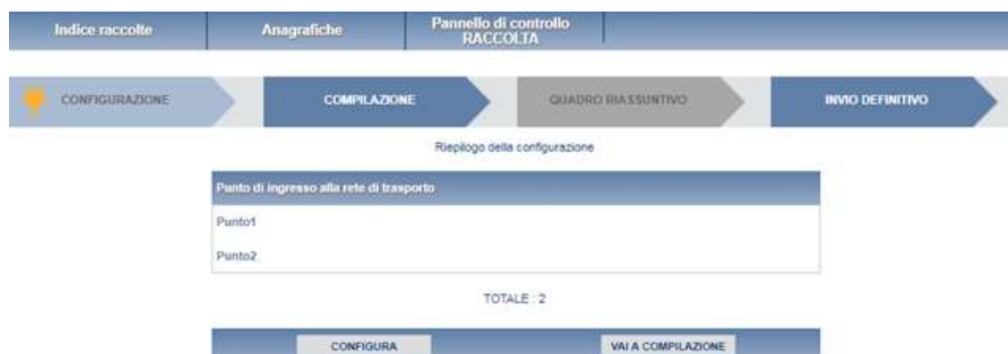
Figura 3.1: Riepilogo della configurazione

Premendo il pulsante “VAI A COMPILAZIONE”, invece, si passerà alla fase di compilazione.