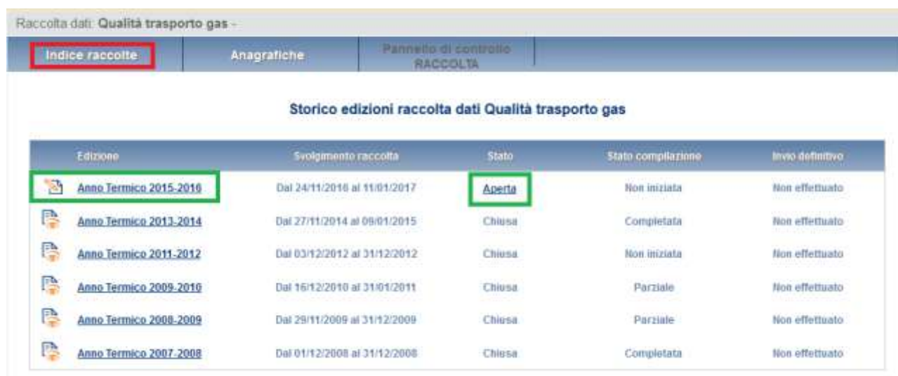
Figura 1.3: Storico della raccolta

Accedendo alla raccolta viene visualizzata la pagina “Pannello di controllo” (figura 1.4), dove è presente un elenco di due voci: “Area Omogenea di Prelievo” e “Punto di ingresso alla rete di trasporto”.