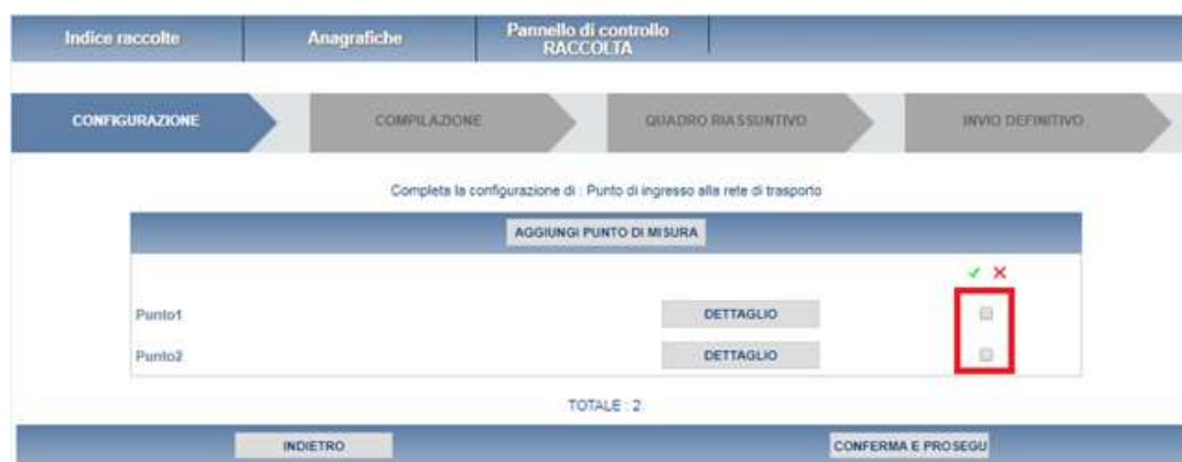
Figura 2.4: Elenco delle configurazioni effettuate