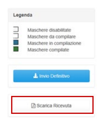
Figura 2.4: link ricevuta invio definitivo

ATTENZIONE: ad invio definitivo effettuato le maschere e la configurazione non sono più modificabili. Ulteriori modifiche che si rendessero necessarie successivamente, potranno avvenire solo richiedendo una rettifica agli uffici dell'Autorità.