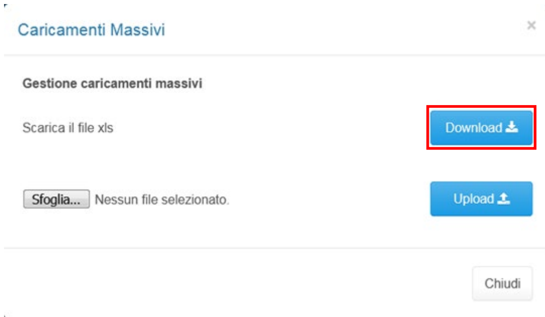
Figura 2.3: caricamento massivo

Per prima cosa occorre scaricare il template Excel (.xls), cliccando sul tasto Download (riquadro rosso in Figura 2.3). Il file scaricato conterrà (se presenti) i dati già caricati.