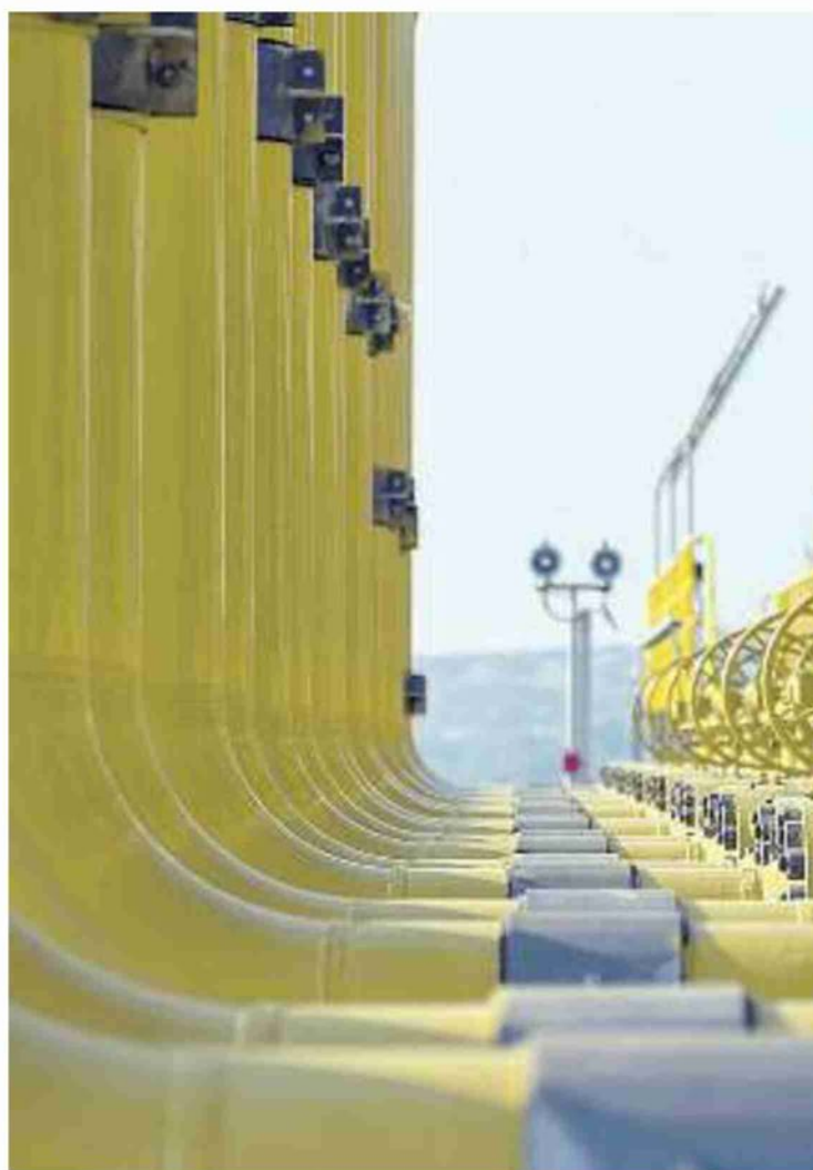
La partenza del gasdotto Tap da Kipoi, al confine greco-turco