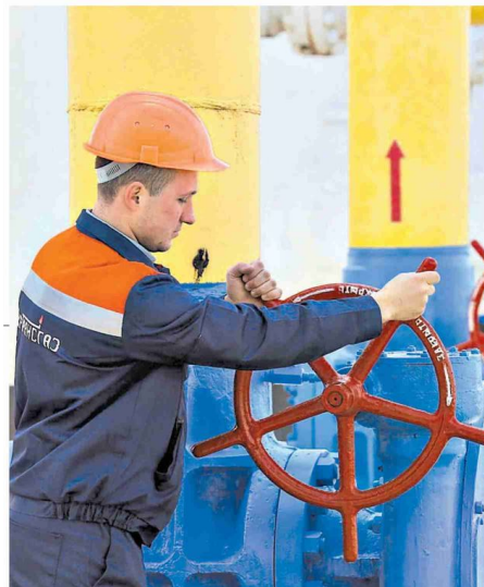
▲ L'annuncio Arera, autorità dell'energia, annuncia le indagini

Snam comincia a riempire gli stoccaggi, mentre Edison taglia le forniture russe per il Gnl americano